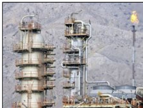
Iran's South Pars gas field (file photo)

February 14, 2007 (RFE/RL) -- Like all oil and gas majors, the Royal Dutch/Shell Group has its eyes open for new sources of supply as global demand for energy grows. Iran is just such a possible source, with the world's second biggest reserves of natural gas.